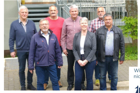
Wir können den Wind nicht ändern, aber wir können die Segel richtig setzen Aristoteles

Die beiden Brücken müssen demnächst von der Stadt abgebaut werden.