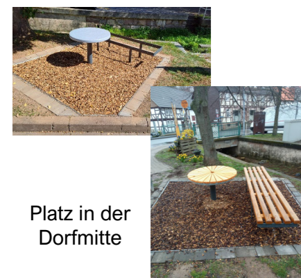
Platz in der Dorfmitte