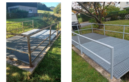
Flutgrabengeländer im Siester

Schick uns gern Anregungen wenn Du eine Idee für ein Projekt oder eine Aufgabe hast.