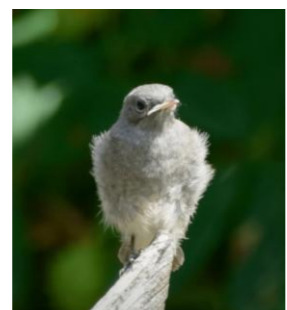
Ein junger Hausrotschwanz bittet alle Katzen und Hunde Halter darum am Leben bleiben zu dürfen.

Nehmen Sie daher Rücksicht – Bodenbrüter wie Feldlerche, Rebhuhn und Goldammer benötigen geschützte Ruhezeiten für die Aufzucht ihrer Jungen.