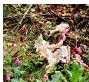
Fleischabfälle auf dem Wolfsberg Parkplatz

Dies ist keine gute Idee – solche Abfälle ziehen Wildtiere wie Wölfe in die Nähe des Dorfes, was nicht nur problematisch, sondern auch äußerst unhygienisch ist.