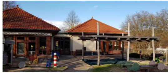
Den Kindern stehen 388,3 qm Spielfläche im Haus und 1505,7 qm Außengelände zur Verfügung.

Wir sind hier, am oberen Rand des Dorfes, idyllisch eingebettet in die Natur und haben viel zu bieten. Unsere evangelische Einrichtung besteht aus 2 Gruppen in der bis zu 50 Kinder (auch integrativ) im Alter von 2 Jahren bis zum Schuleintritt pädagogisch betreut und nach den Vorgaben des hessischen Bildungsplans begleitet werden.